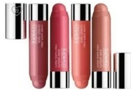
Gambar 2.6 Chubby Pencil Blush

Pencil blush kemasannya menyerupai pensil mudah dibawa kemana saja. Cocok untuk jenis kulit normal. Sedangkan tint blush teksturnya lebih cair dari gel blush . Kemasannya berbentuk stick atau botol. Formula tint blush cocok untuk kulit normal yang cenderung berminyak.