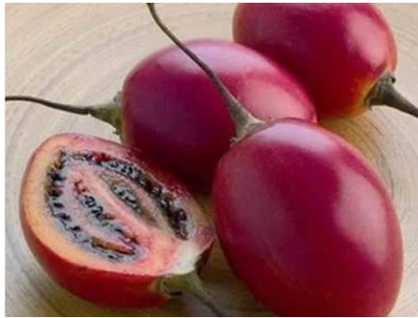
Gambar 2.1 Terong Belanda ( Solanum betaceum )

Biji terong belanda berwarna coklat muda hingga kehitaman dengan struktur yang keras dengan bentuk yang agak tumpul, bulat dan kecil namun lebih besar dari pada biji tomat (7). Dapat dilihat pada gambar 2.1.