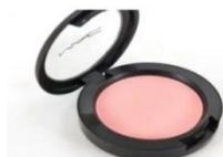
Gambar 2.2 Powder Blush

Terdiri dari serbuk yang dipadatkan bentuknya mirip bedak padat ( compact powder ). Partikelnya sangat padat sehingga warnanya lebih nyata saat diaplikasikan sebagai pemerah pipi. Formulasinya cocok untuk semua jenis kulit terutama untuk kulit berminyak.