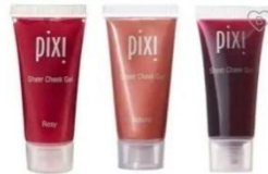
Gambar 2.5 Gel Blush

tangan. Blush on gel cocok untuk semua jenis kulit terutama kulit kering dengan tampilan wajah yang natural.