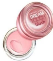
Gambar 2.3 Cream Blush

Teksturnya yang cenderung basah membuat blush on krim mudah digunakan dengan tangan. Formulanya cocok digunakan untuk jenis kulit kering namun hindari penggunaannya saat kulit pipi berjerawat.