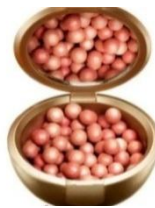
Gambar 2.4 Blush On Ball

Blush on ball bentuknya menyerupai warna-warni bola-bola kecil. Cukup dengan memutar kuat beberapa kali diatas bulatan tersebut dan warna sudah menempel pada kuas. Cocok digunakan untuk semua jenis kulit.