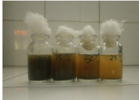
Konsentrasi Infusum Daun Sirih