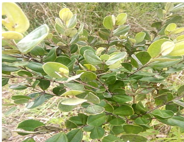
Gambar 2.1. Tumbuhan Karamunting

Karamunting adalah termasuk famili Myrtacea (suku jambu-jambuan). Karamunting merupakan tanaman bertipe perdu berkayu dengan tinggi mencapai 4 m. Letak daun bersilang berhadapan daun tulang, daun berjumlah tiga dari pangkal meruncing, tepi, rata, permukaan bagian atas mengkilap, sedangkan permukaan bagian bawah kasar karena memiliki rambut-rambut halus, panjang 5-7 cm dan lebar 2-3 cm. Bunga berwarna merah muda keunguan, bertipe majemuk. Buah muda berwarna hijau menjelang matang warna yang semula hijau menjadi merah sampai ungu dengan rasa yang manis (7).