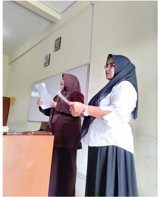
Gambar 2. Peneliti dibantu guru sedang menjelaskan cara pengisian kuisiner