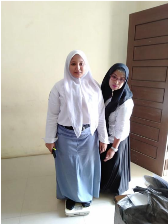
Gambar 4. Peneliti melakukan penimbangan berat badan responden di Kelas XII MIA