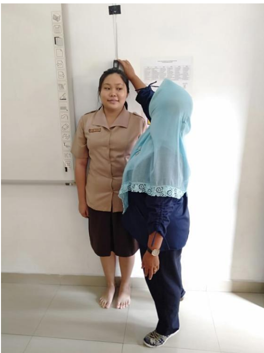
Gambar 6. Peneliti melakukan pengukuran tinggi badan responden di Kelas XII IIS