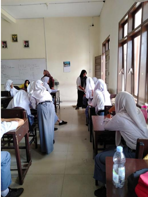
Gambar 1. Peneliti membagikan kuisiner kepada para siswi SMA Pangeran Antasari