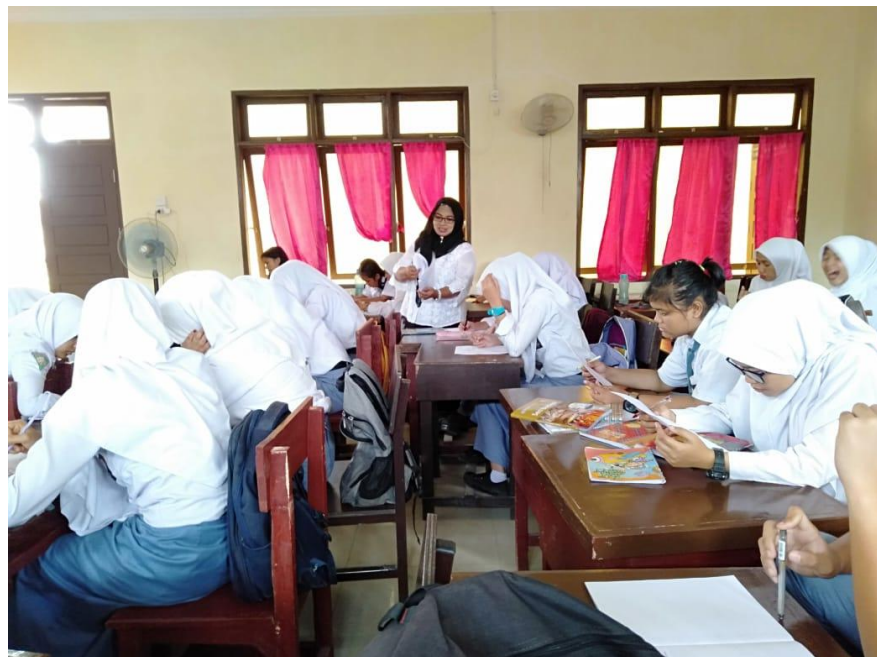
Gambar 3. Peneliti mengawasi pengisian angket di kelas