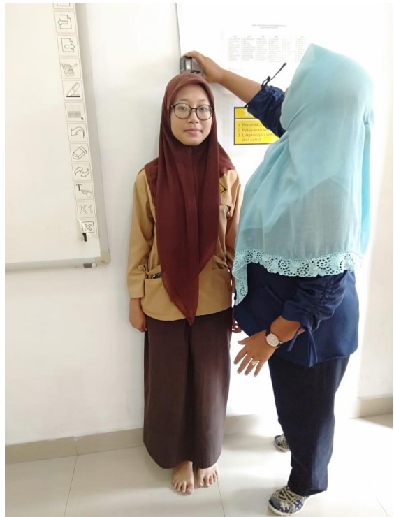
Gambar 7. Peneliti melakukan pengukuran tinggi badan responden di Kelas X MIA