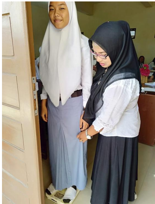
Gambar 5. Peneliti melakukan penimbangan berat badan responden di Kelas XI IIS