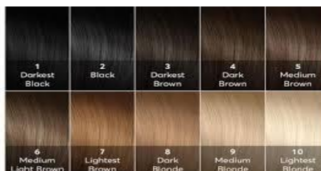
Gambar 2.2. Natural Color Levels