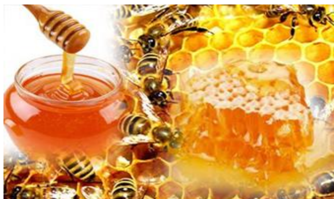
Gambar 2.2. Madu

Di dalam madu terdapat banyak sekali kandungan vitamin, asam, mineral dan enzim yang sangat berguna sekali bagi tubuh dan pengobatan secara tradisional, antibodi dan penghambat pertumbuhan sel kanker. Madu mengandung asam organik yang bermanfaat bagi kesehatan. Selain asam organik, dalam madu juga terdapat kandungan asam amino yang memiliki khasiat membantu penyembuhan penyakit dan berperan dalam mengoptimalkan fungsi otak (8).