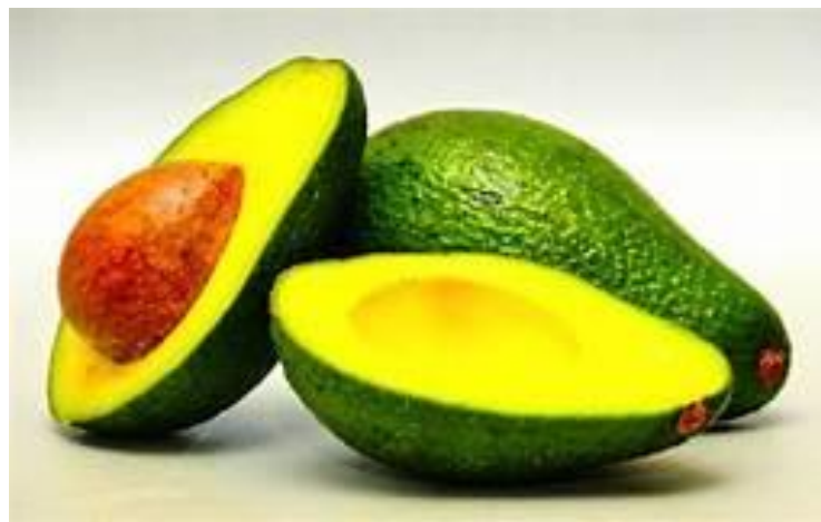
Gambar 2.1. Buah Alpukat